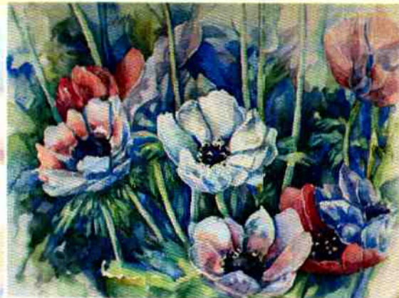
Цветущие анемоны, б., акв., 2018 г.

В каждом городе есть своя площадь вокруг собора, где живут певучие органы. Внутри соборов холодно, толстые стены не пропускают летнюю жару. Эти церкви похожи на суровых средневековых рыцарей, стерегущих покой своих прихожан. В городе Мюльхаузен, который насчитывает почти тысячелетнюю историю, 15 соборов, по числу когда – то существовавших здесь рыцарских орденов. В одном из них – церкви «Дивиблази», заплатив за возможность играть на органе, начинал свой творческий путь юный И.С. Бах. Сейчас рядом с собором стоит памятник-молодой юноша, рядом с пьедесталом, на котором выгравировано знаменитое имя.