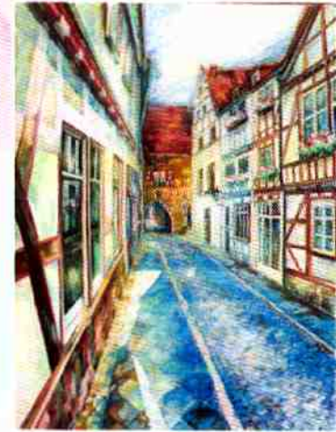
Ратуша. Мюльхаузен, х.м., 2018 г.

Почти не видно людей и потоков спешащих туристов – провинция. От этого атмосфера нереальности усиливается – кажется, что находишься среди сказочных декораций, где можно встретить героев Братьев Гримм... Так родилась серия картин «Цветы & Города». Мюльхаузен, Батлангензальца, Гота, Эрфурт – именно небольшим городкам присуща архитектурная аутентичность и свое неповторимое лицо. Это картины про радость, самобытность и душевную теплоту. Они создают хорошее настроение, зовут путешествовать и осваивать новые горизонты.