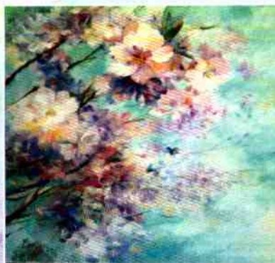
Цветущая сакура, х.м., 2018 г.

Картины находятся в музеях, галереях и частных коллекциях России, Франции, Болгарии, США, Канады, Германии, Словении, Англии.